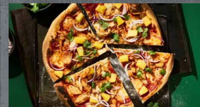
SNABB KOREANSK KYCKLINGPIZZA